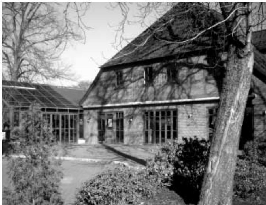
Das Lim's in Erbstorf befindet sich in einem alten Landhaus mit angebautem Glaspavillon