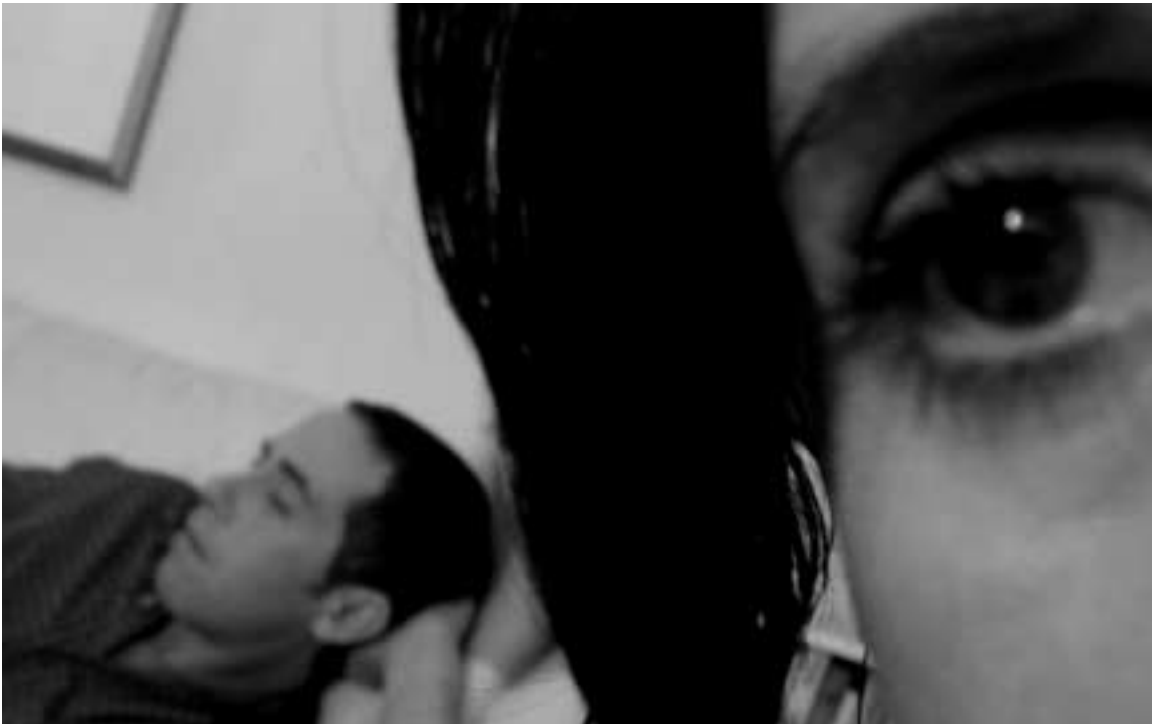
Erst seit 1997 ist Vergewaltigung in der Ehe strafbar

Dass weltweit an vielen Orten selbst die fundamentalsten Rechte manchen Frauen aus den unterschiedlichsten Gründen noch verwehrt werden, ist unverändert – die Beispiele von christlich