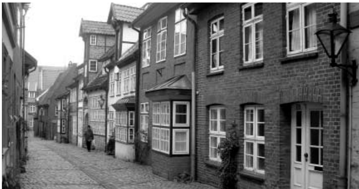
Den Anwohnern des Michaelisviertel wird manchmal auch aufs Frühstücksbrett geschaut

man später wohnen konnte,“ so Pomp in seinen Ausführungen zur „Rettung der Westlichen Altstadt“.